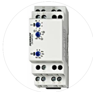
Tidsstyring og Releer