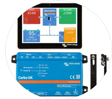
Overvåking og beskyttelse