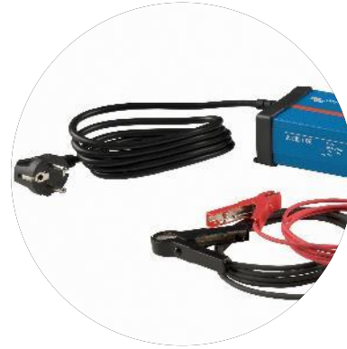
Ladere og Invertere